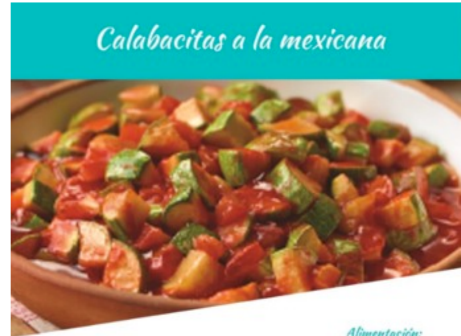
Calabacitas a la mexicana